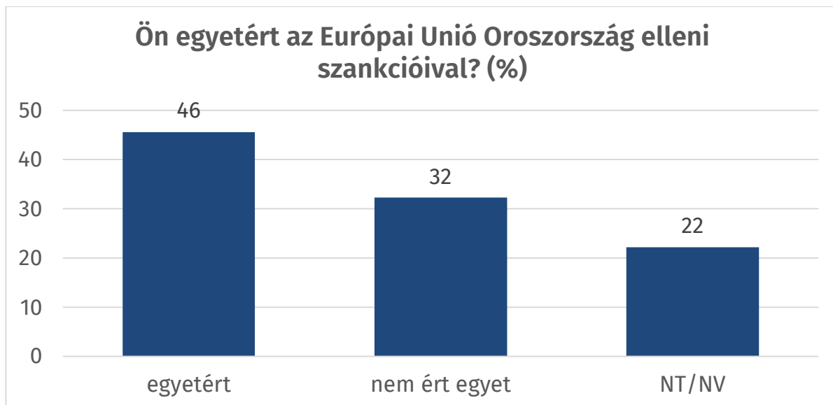
1. ábra: Az uniós szankciók megítélése a teljes népesség körében (%)